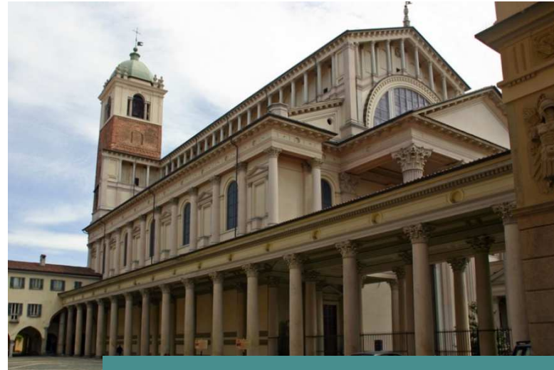
Roman Catholic Cathedral dedicated to the Assumption of the Virgin Mary is the seat of the Bishop of Novara

María se quedó con ella unos tres meses y volvió a su casa.